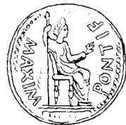
Lampóoka kóba ni. (Mateo 22:19)

22 Yesu mbuai ánfí lóbwie amú ɔnɔ́. Mú su benatí.