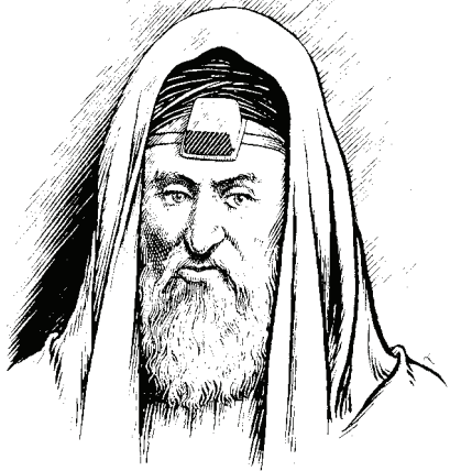
Farisiyin ni. (Mateo 23:5)

23 1 Asún ánfí ɔma a, Yesu lébláa ɔɔm amu pú mu akasípú amu ɔbée, 2 “Mose mbla Farisifo pú Mbla asunápú amu budesuná. 3 Mú su mligyi amú asun blíhé féésú, táme mlumátsiá amú atsiábi. Tsúfé butamagyi amú onutó asun blíhésu. 4 Butɔpú atɔ dwindwín sùrá ahá, táme amú onutó butamapú osrebi ɔkule kùráá tsá amú tsu. 5 Butɔbwé amú tógyító ahá ansísú. Butɔwánlín Bulu asún dínká tati téihésu, púklí amú ɔsukpi pú amú bina ɔbasu. Butɔlú nfé tíntíntín síansían amú atadié ɔnó. 6 Butekle otsiákpá yilé tsiá nke ogyíkpá pú Yudafɔ Ofiakpa. 7 Bedáli yɔ dɔnsu á, butekle beé ahá butíi amú beé, ‘Asunápú,’ abubun ha amú itsiá. 8 Mli féé á, apíó mligyí. Mú su mlumáha abuti mlitɔ ɔhaa osunápú. ɔbakúle pé gyí mli osunápú. 9 Ali kén mlumáti ɔhaa mli sí ɔsolúu anfisú ní. Tsúfé ɔsí ɔkule pé mlibu, ɔbu ɔsúsú. 10 Tráhetráhe a, mlitɔ ɔhaa máha abuti mu nkpa ogyápu. Tsúfé nkpa ogyápu ɔkule pé mlibu. Mɔgyí Kristo, (ɔhá ámúú Bulu ladá mu ofúli amu). 11 Mlitɔ ɔhande ɔbwée mli osúmpú. 12 Tsúfé