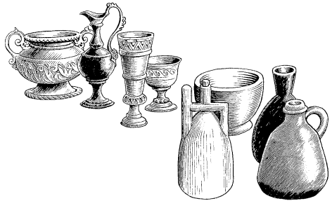
Anzi mà, itsu mà, ndirò òrú odziya nà sumatidò nǎ ka kóbhòlò idzá wìtù-tidò (2.20)

23 Nyi nyàkǎ nyòdhò ìmbǎ tǎya nà ndirò ìmbǎ ídzi dhu mà arǎi òyà agòta. Nyi nyùnì wà dhu, kà rarí anya ibho. 24 Obhó tí, Ádrùngbǎle Kàgàwà bhà ìnò rǎ nzì àdù anya ònzì. Pbétù kǎkǎ ndí'ì ìyò arádi kóró ale màna ale tí, ndirò dhu