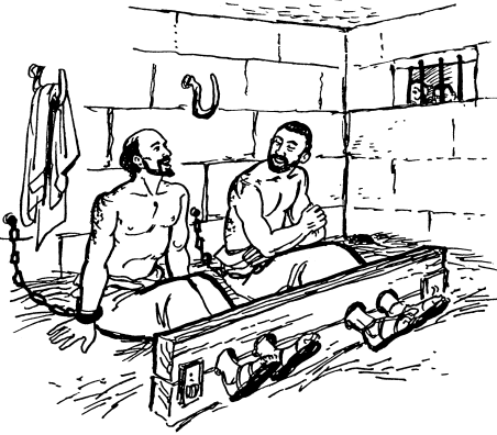
Pòlò mà Sílà nà-pfò ka kubé òná kòmò (16.24)

tí kúbhingánà, Sàndírì adù Pòlò mà Sílà nà ùgù, ndù'ò ròyá otù. Kòkò ale-rò otù ndì ndù'ò rórò tí, àbadhi mà kórò pòndà idzá-bhà mànà náadù bàtizò àlù. 34 Nírò ní ndi kádù Pòlò mà Sílà nà ùgù ndàrà nà pòndà idza, ndàdù ònyè àbhù fíyò. Ní wò ale mà, kórò pòndà idzá-bhà mànà-idhè náadù ndìka atdíð Kàgàwà ì à'ù dhu-okú dò rò.