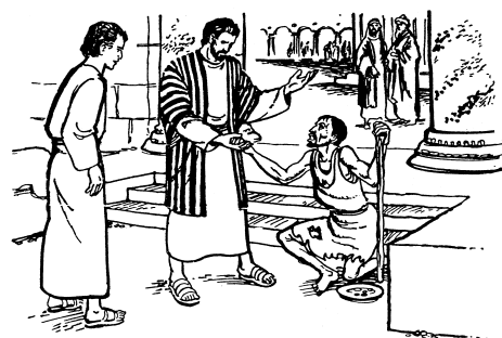
Péterù mà Yùwanì nà rǝ òtsòtsù rǝrǝ ka kugǝ ale nígǝ dhu (3.6)

7 Wò dhu-dzidǝ, Péterù adù wò ale àlu fangà tǝ ɔtsúna rǝ, ndìva ɔrǝ. Ní urǝ rǝ tí, kà-pfǝ mà kà-pfǝ-kilìtà mànà náadù ɔbì nábà. 8 Ní wò ale ibe ndì ndidè pfǝna dǝ, ndàdù abhi ɔpè. Àbadhi mà náadù òtsù atdíkpá Kàgàwà bhà idza, Péterù mà Yùwanì mànà nà. Ní àrà ndì ndàrà rǝrǝ, wò ale ambénà ndǝbhè dǝ òbhè tí, Kàgàwà nílè ndì ndí