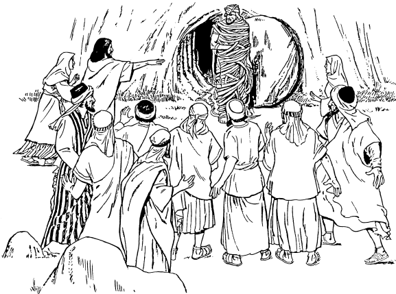
Làzarù ka katdù ònà bhalabhala tó odu ò ka kógyè ibhu (11.44)

43 Wò dhu ndì ndòrì dhu-dzidǒ, Yèsù adù Làzarù nánzi òrù tǔna nyú nà, ndàti: « Làzarù, àhù wòrì ibhu ò rò. » 44 Ní, Làzarù adù àhù ibhu ò rò, òtsúna mà, pǒna mànà ka kèndìlì