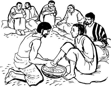
Yèsù rĩ p̄bìndà ábhàlĩ-pf̄ò nù'ò ndàdù ùndonà dhu (13.5)

tí, Yèsù nùni ndìpf̄ò rí ndàbhu ndì òmvũ-f̄ò ale angyangyi. Ndi dhu-okú d̄ò r̄ò ní ndi k̄ati p̄bìndà ábhàlĩ nĩ : « Nyĩ k̄óró, nyĩ nyilã nzá Kàgàwà-nyìkp̄ò ǎ. »