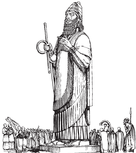
Nabucodonosor quichijqui se teteyotl tlen oro.

3 Huan teipa nopa Tlanahuatijquetl Nabucodonosor tlanahuati ma quichijchihuica se teteyotl tlen oro catli quipixqui 26 metros ihuejcapanca huan nechca eyi metros itomajca. Huan tlanahuati ma quitlalica ipan ne tlamayamitl catli itoca Dura nechca altepetl Babilonia. 2 Teipa tlanahuati ma mosentilica nochi catli quihuicayayaj tequiticayotl ipan nochi tlamme ipan itlanahuatilis. Quinnotzqui itlapalehuijcahua, itlaconsejomacacahua, ipresidentes, igobernadores, ijueces huan itlayacanca soldados huan catli quimocuitlahuijque itomi. Tlanahuatijquetl Nabucodonosor quinilhui ma hualaca huan quiilhuichihuilise nopa hueyi teteyotl catli quiquetztoya. 3 Huajca ajscicoj nochi huejhueyi masehualme huan mosentilijque iixpa nopa teteyotl para quiilhuichihuilise. 4 Huan se tlanojnotzquetl chicahuac camanaltic huan quinilhui nopa masehualme: “Xijtlaqaquilia, nochi anmasehualme catli anhualajtoque campa hueli tlamme huan catli ancamanaltij tlen hueli camanali catli onca. 5 Quema anquicaquise tlapitzaj nopa tlatzotzonani ica nochi