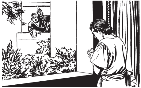
Daniel motlatlajti ica Toteco Dios quen nochipa quichihuayaya.

10 Huan quema Daniel quimatqui para nopa acta ya quichijtoya, yajqui ichaj ipan nopa cuarto huejcapa campa momatqui motlatlajtía ica Toteco Dios. Huan quitlapo nopa ventanas para quitlachilis iixmelacampa ica huejca ipan seyoc tlali mo cajqui altepetl Jerusalén. Huan nozona quen ipa quichihuayaya, motlancuaquetzqui iixpa Toteco Dios expa se tonal; huan motlatlajti huan quitlascamatqui. 11 Huan nopa tlacame mosentilijque huan yajque ichaj para quipijpiyatoj. Huan quipantijque Daniel motlatlajtíyaya iixpa Toteco Dios huan quitlajtlaniyaya itlapalehuil. 12 Teipa injuanti yajque iixpa nopa tlanahuatijquetl huan quitlatzintoquilijque tlen nopa acta catli quisencajtoya, quiilhuijque: