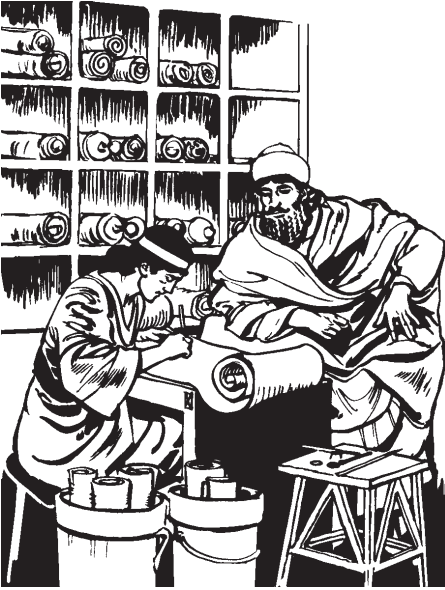
Quijcuilo se amacamanali ica itequiticayo nopa tlanahuatijquetl.

cahuayojme catli tlahuel quimatque motlahuaj. Nopa cahuayojme eliyayaj iconehua icahuayo nopa tlanahuatijquetl catli más huelqui motlahua. 11 Huan ipan nopa amacamanali nopa tlanahuatijquetl quinnahuatiyaya israelitame ipan campa hueli altepeme ipan nochi municipios ipan nochi tlalme ma mosentilica para momanahuise. Quinchuili ma quinmictica huan ma quintzontlamiltica nochi catli quinequiyayaj quinhuilanase masque tlacame, sihuame o coneme. Nojquiya quinnahuati ma quicuica nochi catli eliyaya iniaxca catli quinhuilanasnequiyayaj. 12 Nochi ya ni monequi quichihuase ipan san se tonal ipan nochi ialtepehua Tlanahuatijquetl Asuero. Huan nopa tonal catli quiixquetztoya elqui ipan 13 itequi nopa metztli majtlaclti huan ome, nopa metztli Adar ipan toisraelita calendario § ipan ne seyoc xihuitl. 13 Huan se iixcopinca nopa amatlajcuiloli monejqui ma tenextilica ipan campa hueli municipio