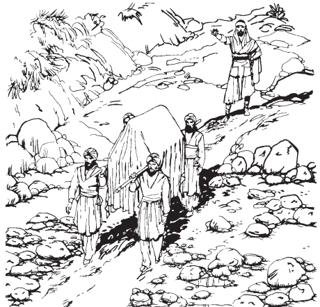
Totajtztzi quihuicayayaj nopa caxa para quiixcotonase hueyatl Jordán.

14 Huajca nopa israelitame quisque pa- ra quiixcotonase hueyatl Jordán, huan no- pa totajtztzi quintlayacancuilijyayaj qui- huicayayaj nopa caxa catli quipixqui catli ininhuaya mocajqui TOTECO. 15 Huan el- qui ipan nopa tonali para pixquistli quema