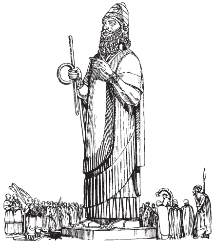
Nabucodonosor quichijqui se teteyotl tlen oro.

chihuaca se teteyotl tlen oro tlen quipixqui 26 metros ihuejcapanca huan nechca eyi metros itomajca. Huan tlanahuati ma quitlalica ipan ne tlamayamitl tlen itoca Dura nechca altepetl Babilonia. 2 Teipa tlanahuati ma mosentilica nochi tlen quihuicayayaj tequihuejcayotl ipan nochi tlatlani ipan itlanahuatilis. Quinntozqui itlapalehuicahua, itlaconsejomacahua, ipresidentes, igobernadores, ijueces huan itlayacanca soldados huan tlen quimocuitlahuijque itomi. Tlanahuatijquetl Nabucodonosor quinilhui ma hualaca huan quihueyitlali Daniel se teteyotl tlen quiquetztoya. 3 Huajca ajsicoj nochi hueyhueyi tlacame huan mosentilijque iixpa nopa teteyotl para quihueyitlali Daniel. 4 Huan se tlanojnotzquetl chicahuac camatqui huan quinilhui nopa tlacame: “Xijtlacaquilica, nochi intlacame tlen inhualajtoque campa hueli tlatlani huan tlen incamatij tlen hueli tlajtoli tlen onca. 5 Que ma iniquicaquise tlapitzaj nopa tlatzotzonani ica nochi inintlapitzalhua, nimechnahuatía ximotlancuaquetzaca huan xijhueyichihuaca nopa teteyotl tlen oro tlen Tlanahuatijquetl Nabucodonosor tlanahuati ma quisencahuaca. 6 Huan intla