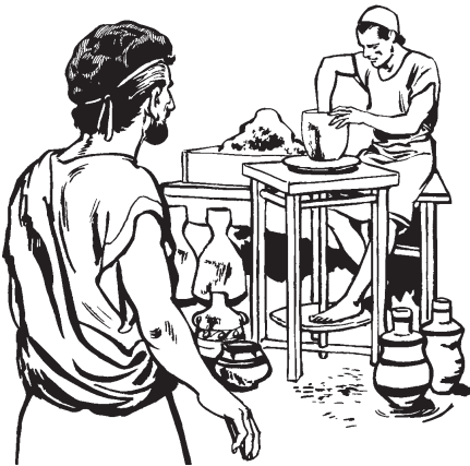
Jeremías quipaxalo ichaj nopa soquichijquetl.

3 Huajca na niyajqui ichaj nopa soqui- chijquetl huan nijpantito tequitiyaya. 4 Pe-