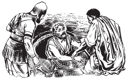
Quiquixtijque Jeremías ica mecatl ipan nopa ameli.

Huajca na nijchijqui queja nechnahua-ti. 13 Huan nechquixtijque ica laso ipan nopa ameli huan nechcajque ipan nopa