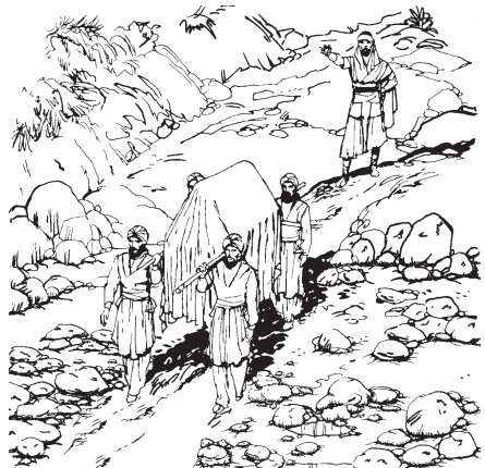
Totajtzitzi quihuicayayaj nopa caxa para quíxcotonase hueyatl Jordán.

14 Huajca nopa israelítame quisque para apanose atemítl Jordán, huan nopa totajtzitzi quintlayacancuiliyaj quihuicayayaj nopa caxa tlen quipixqui tlen inihuaya mocajqui TOTECO. 15 Huan elqui ipan nopa tonali para pixquistli quema nopa atemítl Jordán temic miyac. Huan quema nopa totajtzitzi calajque ipan nopa atemítl huan