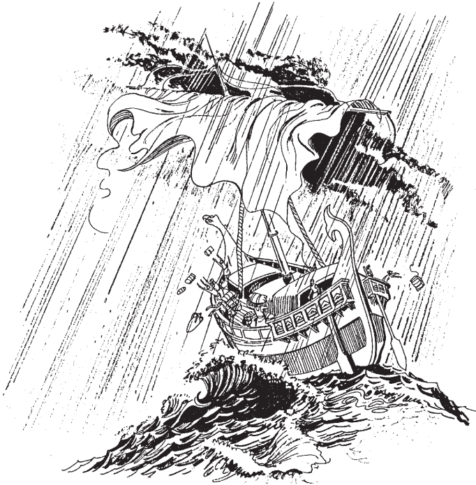
Oajakak chikauak ipan mar niman on barco oapolak (27.15)

niman ika sanoyej temojtij techuitekiya on ajakatl, tikuitiyaj ompa timikiskiaj.