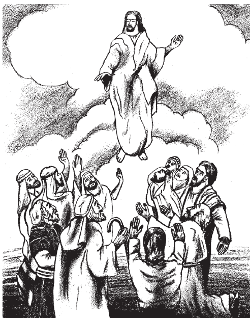
Jesús otlejkok ne iluikak (1.2)

1 1 NotlajsojkaTeófilo, ipan on achtoj amamoxtli* onikijkuiloj nochi on tlajtlamach* tlen Jesús okichiu niman okitemachtij ijkuak opeu itekiu 2 hasta ijkuak yejua otlejkok iluikak. Ijkuak yejua xe tlejkouaya iluikak, ika ipoder on Espíritu Santo, Jesús okinnauatij tlinon kichiuaskej on tlakamej yejuan okintlapejpenij