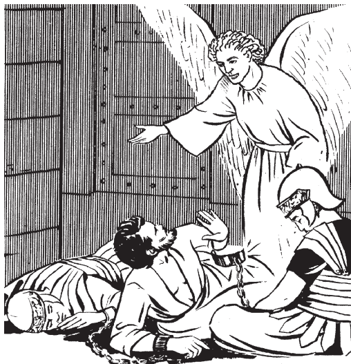
Sen ángel okitlachaltito Pedro para ma kisa ne kampa tsakutikaj (12.7)