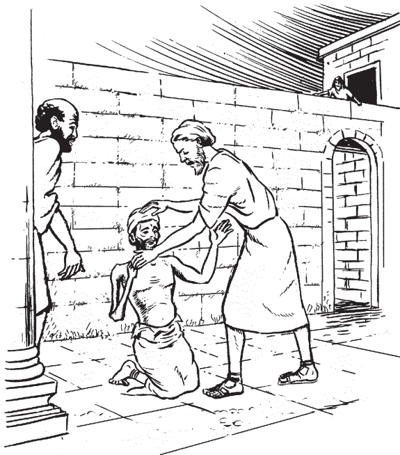
Pedro niman Juan okipajtijkej sen uilatsin ikan itokatsin Jesucristo (3.7)

onotekets, opeu nejnemi. Kemaj inuan Pedro niman Juan okalak ne ipan on ueyitiopan, nejnentiaya, niman tsikuintiaya niman kiyektenejtiaya Dios. 9 Ijkuak nochi tlakatl okitak nejnemi niman kueyilia Dios, 10 sanoyej* okintlalachaltij niman omojmojkatlachixkej ika on tlen onochiu. Ijkon onochiu pampa kixmatiyaj on tlakatl niman kimatijaj ika sano yejua on akin notlaliaya ne tiopankiauatenko itoka “Kualtetsin”, para kitlajtlaniya limosna.