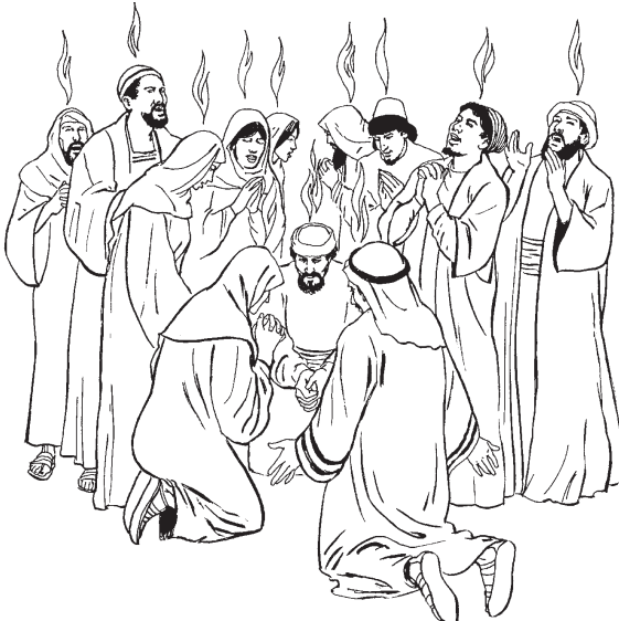
On Espíritu Santo ouajlaj (2.3)

5 Ipan on tonaltin chantiyaj ompa Jerusalén hebreos* yejuan kuajli kitlakaitayaj Dios. Yejuamej uajualeuayaj de nochiiuyan ipan in taltikpaktli. 6 Niman ijkuak okakistik on kokomokalistli, onosentlalijtetskej on tojlamej. Ijkuakon on tlakamej xkimatiyaj