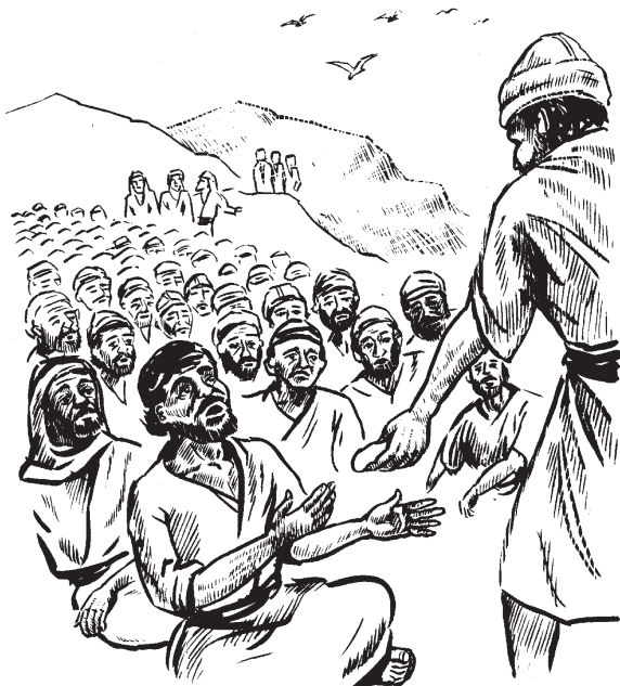
Jesús okitlakualti majkuijli mil tlakamej (6.11)

13 Ijkon tej, okisentlalijkej on tlatlajkotsitsin yejuan onokau itech on makuijli pan tlachijchijitli ikan cebada niman okitemiltijkej