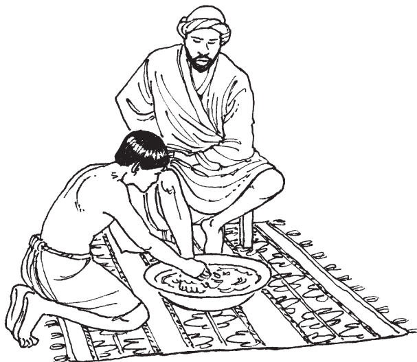
Jesús okinmikxipajpak inomachtijkauan (13.5)

okitekak atl ipan sen ueyi teposuajkajli niman opeu kimikxipaj-paka inomachtijkauan* niman kimikxiuajuatsaya ikan on tela yejuan kipiyya ixijlan. 6 Ijkuak ye kimpajpakaskia ikxiuan Simón Pedro, Simón Pedro okijlij: