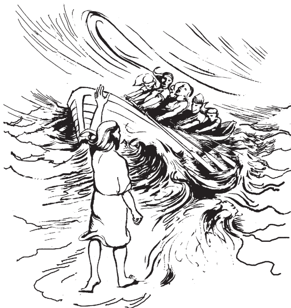
Jesús onejnen ipan mar (6.19)

16 Ijkuak otlayouak on inomachtijkauan* Jesús otemotoj itech on mar. 17 Niman otlejkokej ipan sen barco niman opeu kipanaiyaj on mar para ajsiskej ne Capernaúm. Ye tlayoua katka niman Jesús sanken* xe uajlaya intech. 18 Niman opeu chikauak ajaka, niman tejmotij koxoniya on mar. 19 Niman ijkuak yokinejenkej kanaj makuijli noso chikuasen kilómetros, okitakej Jesús nejnentiu ipan on atl niman ye kinisiuijtiaya on barco. Niman yejuamej onomojtijkej. 20 Pero yejua okinmijlij: