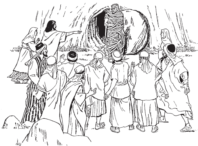
Lázaro oyoliu niman onokuiteu ipan itlalkon (11.44)

44 Niman on mikatsintli ouajkis uajtejkuixtiaya ipan imauan niman ikxiuan ikan ilpikatl niman ixayak tejkuixtikatka ikan tela. On hebreos* ijkon kitekitiltiyaj ijkuak kintejkuiyaj on yejuan yomikkej. Jesús okinmijlij: