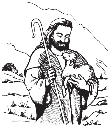
Sen borreguito yejuan opolijka okinextikojkej (15.5)

paktli kuajnokechpanoltia. 6 Niman ijkuak ajsi ichan, kinsentlalia itlajsojkaikniuan* niman inisiuchanejkauan* niman kinmijlia: “Nouan xpakikan, pampa yoniknextij on borreguito yejuan onik-polojka.” 7 Nejua tej, nemechijlia ika ne iluikak no ijki nochuia. Ompa más onkaj paktli ipampa sen tlajtlakolej yejuan noyolpatla xken impampa on 99 kuajkualtin tlakamej yejuan xkipiyaj tline noyolpatlaskej.