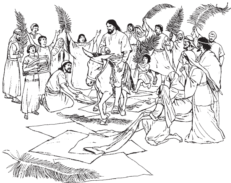
Jesús okalak Jerusalén ijkuak on tlakamej okinekej okalaktijkej ken inrey (19.35)

35 Niman okuikilijkej Jesús on polokotsin*. Kemaj okitlalijkej intlaken ipan on polokotsin*, niman okipaleuijkej Jesús para ipan onotlali. 36 Chika Jesús yetiaya ipan on polokotsin*, on tlakamej kisojtiayaj intlaken ipan ojtli. 37 Ijkuak Jesús oajsik ne kampa peua temoua on ojtli de on tepetl itoka Olivos, nochimej on miyekej nomachtijkej* opejkej pakij, niman kiyekteneuayaj Dios ikan chikauak tlajtoli ipampa nochi on tlamaisoltin yejuan okitakej. 38 On nomachtijkej* kijtouayaj: