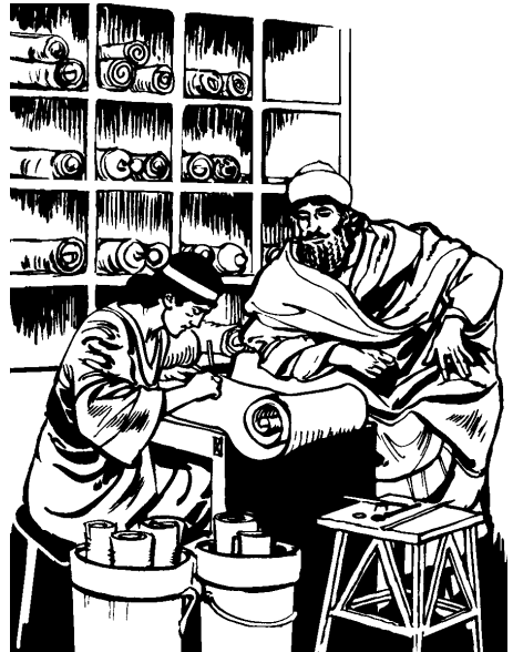
Quiijcuilo se amacam-anali ica itequiticayo nopa tanahuatijquet.

9 Huajca nimantzi ipan 23 itequi nopa metzti eyi ipan toisraelita calendario, nopa metzti Siván f , quinnotzque nopa tajcuilohuani cati quitequipanohuayayaj nopa tanahuatijquet. Huan Mardoqueo quinihujtiyayajqui nochi cati monejqui quijcuilose para quinnahuatise israelitame. Huan quijcuilojque para quintitanilise nochi gobernadores, presidentes huan tequichihuani ipan nochi municipios ipan nopa 127 talme cati pejqui hasta nozona ipan tali India huan ontami ipan tali Etiopía. Huan quijcuilojque sese ica ininca-