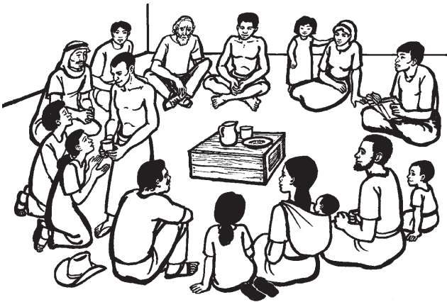
Nuu ndò'iin ti'vi ma ñivi ña chìnuni tu'un Jesuu (4:1)

4 1 Yakan va yu'u indii ma vekaa cha'a' ña kàtitu'in cha'a' ma Racha'nu Jesucristu. Yakan va jàninì ndo ña na koo ndo ma takua ìyo yi ña koo ma ndian kàchin ma Ndioo ña na kuu na ñivi ra. 2 Na kuu ndo ndian masu anima, ta vii kà'an ndo chi'in inga ñivi, ta na jandeeni ndo chi'in ma ña ja'a ta'ii'iin ta'an ndo cha'a' ña ya'a ga kùuni ndo nde'le ndo na. 3 Ta ndisaa tiempu na nanduku va'a ndo naja koo vii ndo chi'in ta'an ndo, ikan na töve naa ma ña ndo'iin ta'an ndo ña chā'a ma Tati Í Ndioo nuu ndo. 4 Ta iin kuñuni kùu yo chi'in ra, ta uvani Tati Í Ndioo ìyo, ta indukuni kāna ndio ra yo, ña ndàtu yo ña va'a ña ni ku'va ra nuu yo. 5 Uvanuu Racha'nu Jesuuni ìyo, ta iin ni ña kùu chinuni yo ndia, ta iin ni kua kuu