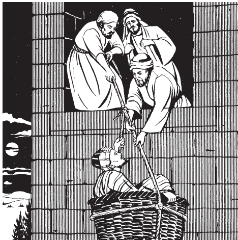
Nuu jākakú ndra meru Paulu ra chi'in iin tuka (11:33)

30 Tu ìyo nda cha'a' ìyo yi ña jatayi na na, nda yu'u ni jatayi yu'u cha'a' ma ña kà'an na ña tüvi ndàkutiñui. 31 Ma Racha'nu