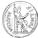
Xü'un' ña nandu'u' nuu' Cesar xata' (22.19)