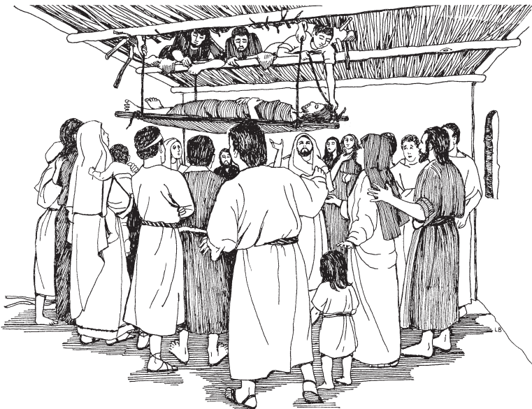
(San Marcos 2:4)