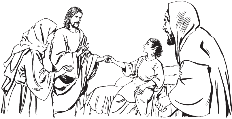
(San Marcos 5:41)

entok simeta juka ä kökoa bétana ä téjhuak, jáchin áu ä sikähui.