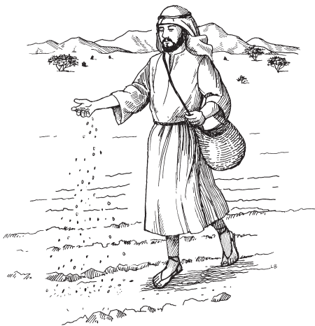
(San Marcos 4:3)

4 1 Jesús júchi bemelasi am majtia táytek jum bahue mayoachi. Huanäi juebena gente au nau yájjak. Jesús éntok canoapo yejteka bahuéu kibakek. Huämi aaney canoapo, síme gente éntok báa mayoachi. 2 Huanäi juebenak am majtiay, ejemplom ámeu jójjoaka, huanäi nokaka ínel am majtiay: