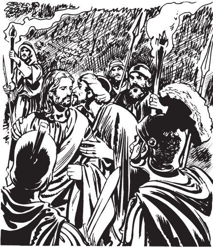
(San Marcos 14:44)

45 Huanäi Judas áma yepsaka, au rúkteka ínel au jiaahua: —Maestro, Maestro.