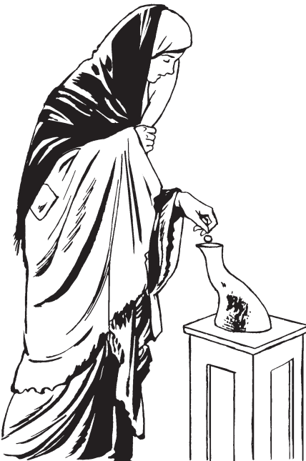
(San Marcos 12:42)

—Tua lútüriapone enchimueu ínel jiaahua, i jámmut póobe jókoptula chë yún áma ä jóiyak simem béppa jum kajompo;