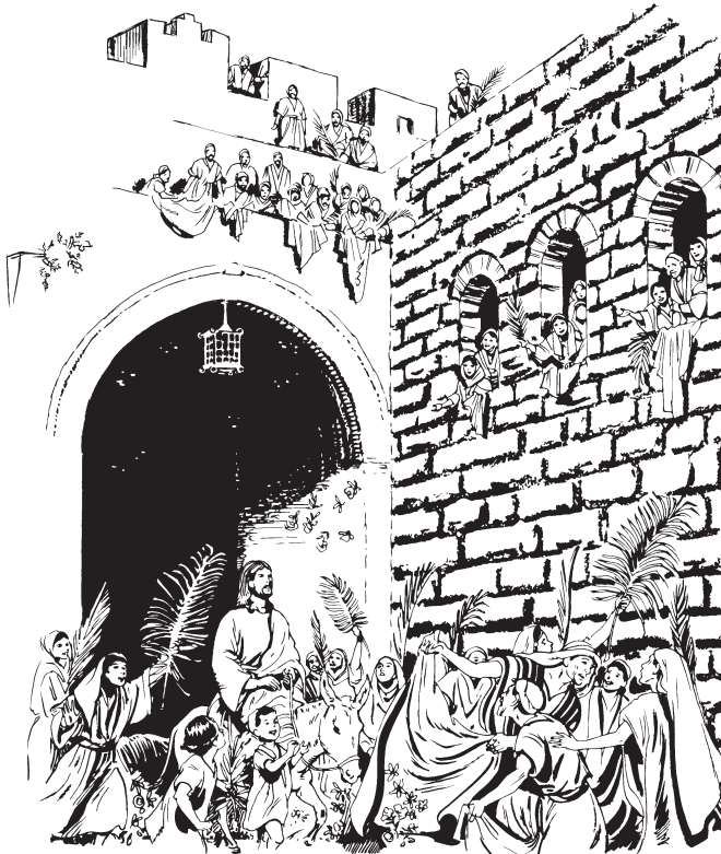
(San Marcos 11:10)

11 Huanäi Jesús buere joära Jerusaléni yepsaka, jum tiöpou kibakek. Huanäi nate chíkola