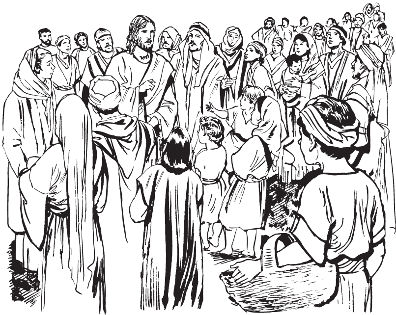
(San Marcos 5:24)

jálojtek júne türinake.” 29 Huanäi áachä jálojtek jíba jü ójbo kíktek. Entok ä türiakäu ínnëak, jü jíbebeata bétana. 30 Huanäi Jesús ä takaahuapo úttiärata át yeu sikamta iinnëaka, huame áamak katemmu kúakteka ínel jiaahua: —¿Jábesu ín sánkommet jálojtek?