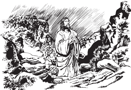
(San Marcos 1:35)

35 Yokoríapo kethuey, ketune unna kútkoako, Jesús yejteka yeu siika ánia see päriau bíchaa. Huämi oraciónta yáhuak. 36 Huanäi jü Simmom,