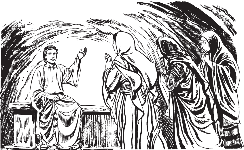
(San Marcos 16:5)

5 Huanärim sépulturapo kimuka, senu yoremta jübua yötumta batatana bétana áma kátekamta bitchak, tósalik tebek sánkokamta; huanärim guómtek. 6 Të áapo ínel ámeu juahua: