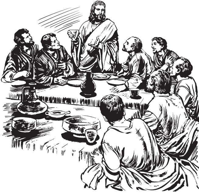
(San Marcos 14:23)

Yoremta Üusi! Türi eiyei huäri yoremta béchibo jahuéi júne kaa yeu tómteko.