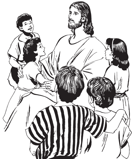
(San Mateo 19:15)

15 Huanäi áme béppa mámteka yeu siika, jum ä aneïpo.