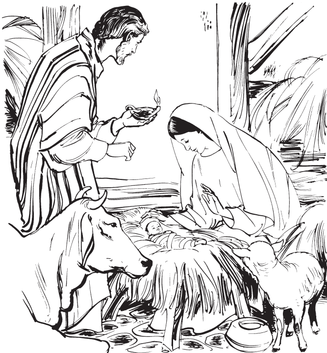
(San Mateo 1:25)

24 Huanäi José búsaka, ángelta nésahui yáuhuak, ä jámut mabetaka. 25 Të kaa ä jubeka bénasi amak jiápsak, bueituk kësam huëpo ili usi outa Mariáta