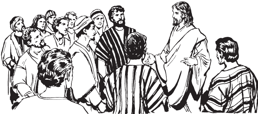
(San Mateo 10:1)

—Jume kaa judíom böommechem kaa kannake, entok samaritano jóärahuem kaa kimunake. 6 Ál-lem israelita jóammet bát kannake, jume kabaram Bénasi emo tárulammehui. 7 Ámanem kateka ä nooka, ínel jíaka: “Jü téhuekapo réy nésauro äbo jëla huéiye.” 8 Kökoremem tüte, lepra sähuakame këtchi; kökkolamem jíabitetua, lemooniomem yeu béeba. Kíalem mikpo ä mabet-la;