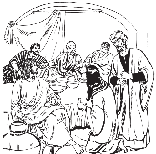
(San Mateo 26:8)

—¿Jatchiakasu ìri kía guötiahua? 9 Bueítuk ìri ára nénkituy, yún tómipo; huanäi jume póobem áy ania éhuay.