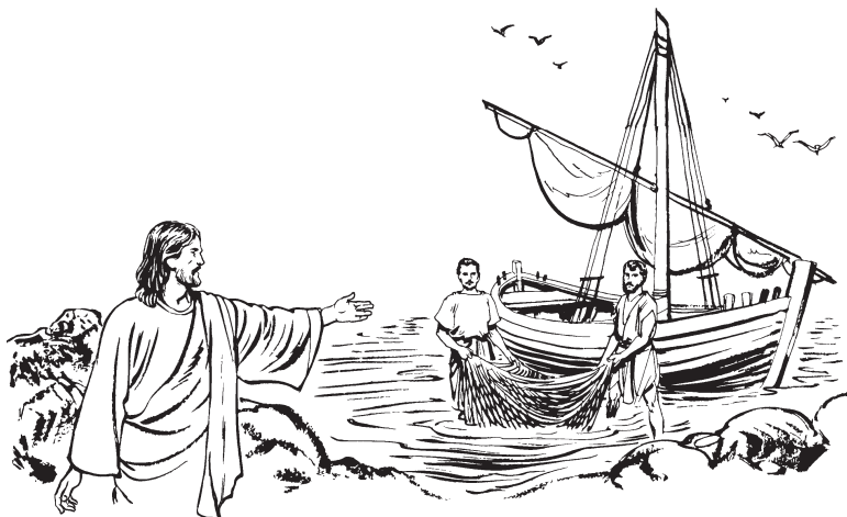
(San Mateo 4:18)