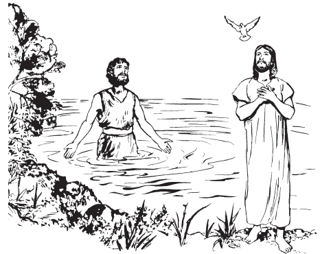
(San Mateo 3:16)

16 Jesús entok batösuhuaka, báapo yeu simlataka jikau ä huey téhueka áu étapok. Huanäi juka Diosta Espíritu bitchak, áa béppa guókouta Bénasi kóm