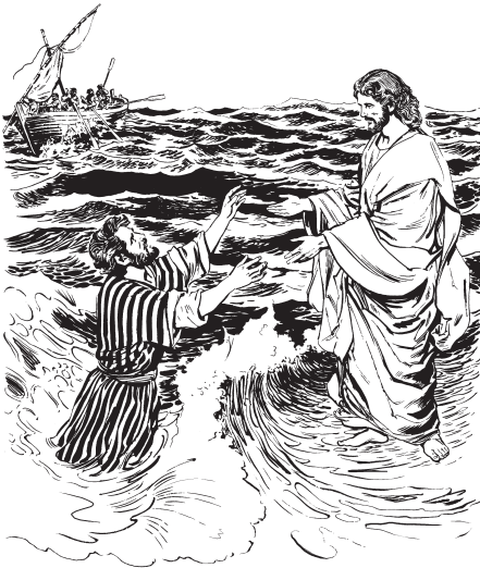
(San Mateo 14:30)

31 Jesús sep áu mámteka, ä buíssek, entok ínel áu jiaahuak: