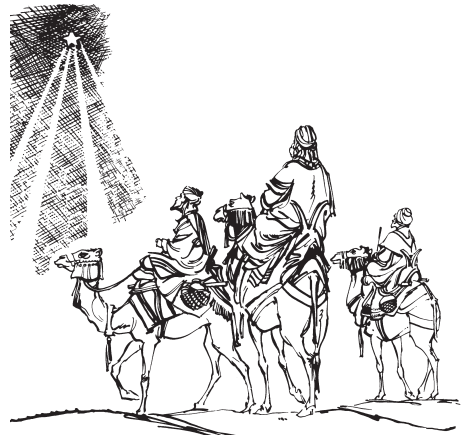
(San Mateo 2:9)

9 Huanärim bempo réyta jíkkajisuka sájjak. Jü chóki éntok täata yeu huë bétana bem bíchakäu ámepat huéesimey. Áman am yájjboy ili usita anë béppa taahuak.