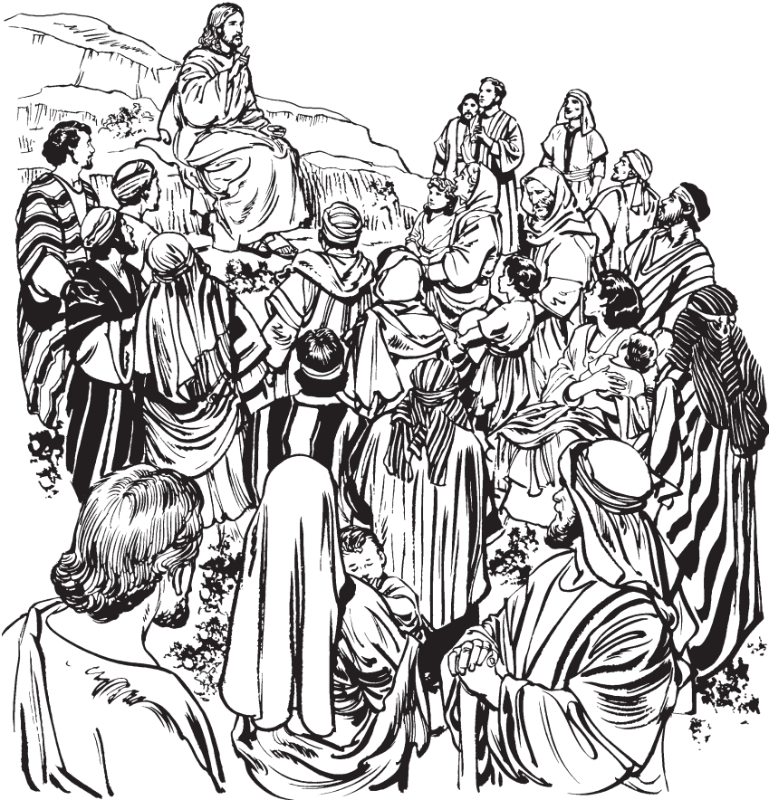
(San Mateo 5:2)

5'Yúmalasim al-leenake, jume yánti emo nüyeka kaa emo jábeleme, bueitukim Diosta bétana ania buíata attiapo mabetnake.