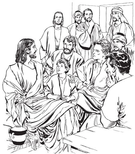
(San Mateo 18:1)

machi, jum téhuekapo Diosta réy nésahuepo?