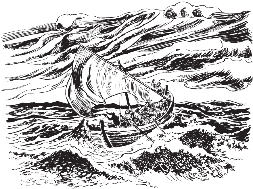
(San Mateo 8:25)