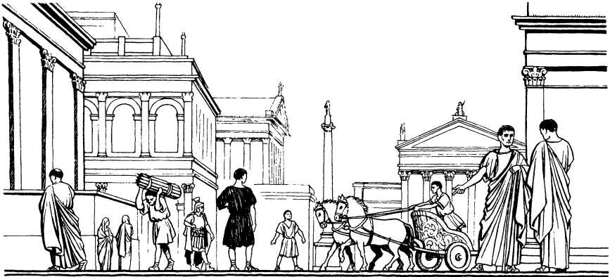
(Ro. 1:7, 15)

wocslabla, jax ju'x cyey cywixel cyc'u'ja. 13 Key hermano, waja cybiy ch'ima maj e cub wu'na tu'n npona cyxola maa tuj Roma. Pero hasta ja'lewe mix nchin poniya. E wajbe'ya tu'n npona tu'n nk'umena tyol Dios cyey, tu'ntzen tajben cyey, tisen o bint wu'na cyxol niy'tl ocslal yaa'n judío. 14 O tzaj tkba'n Dios weya tu'n t-xi' nkba'na te cykilca xjal j-o tzaj tkba'n weya. Il ti'j cxe'l nkba'na cyej xjal griego bix cyej xjal yaa'n griego, bix cyej xjal nmak xjal, bix cyej xjal ajnintzxse. 15 Ju' tzunj nim nganiya tu'n t-xi' nkba'na ba'n tpoctal Cristo te cyey aj Roma, tisen o bint wu'na cye niy'tl xjal.