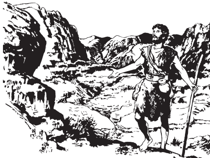
Jè Juan ra batíndá xitā

—'An-ná xitā ra 'nó chjaya ya i'nde kixi nándā xìn'ta: “Ndaá tjjajna kixiqò ndiyá-lā Nā'ín-ná”, koni 'sín kitsò Isaías xitā ra isichjeén Nainá nga kiichja ngajo-lā.