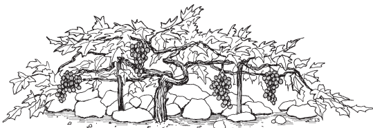
Jè na'ño tja'tsin to uva

15 1 'An-náa ra ngi na'ño je-la to uva, kò jè Na'in-na ra síxáko. 2 Nga'tsi na'ño chrja-la ra ya nchrabá'ta-ni a'ta tsa'an ra mì kì bajà-la to, bate'tá-ní; tanga jè ra bajà-la to batejno-ní nga sítsje, mé-ni nga isa nda kjoa-la to. 3 Ijyeé tsje titsajna-no ra jìòn, nga jnà 'én ra ijye kokíxin-no, jè kjotsje-najiòn. 4 Machjeén-ní nga ya titsajnakò ki'tá-ná, kò 'an