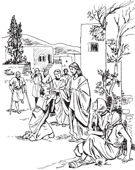
Jesús kjìn x̣iṭa xk'én kisindaà-ne

tsibít'si'ba-ḷa Jesús nga koòt'aà-ḷa tsja jè x̣iṭa jè. 33 Jesús, it'aà xìn kiiḳo ñánda tsjìn x̣iṭa, k'eé jahas'en jnótsja yá líká-ḷa, kò ndánachrá-ḷa kisikaajno nijen-ḷa. 34 Jesús kiskoòtsejèn ngajmii; ikjoàn jaátse-ḷa, kitsò: