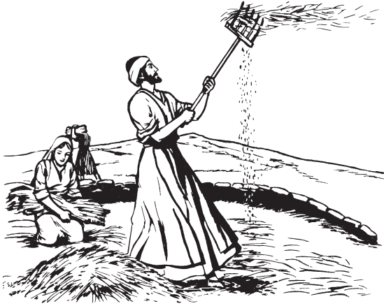
Kií s'ín matsjeè tjé-la trigo

Tanga jè xi nchrobátjngui-na s'iin-nò bautizar kò Inima Tsjeè-la Nainá koa kò ni'ín. Ìsaá tjín-la nga'ño mì k'oaá-ne 'an. Skanda mìkiì tjí'nde-na nga 'an k'íkoaa xojté-la. 12 Jyeé kjinaya tsja jè pala nga siitsjeè tjé-la trigo. Kínchàxkó trigo ya iya ni'nga; kò jè tjé paja kínchàjìin ni'ín nándá nga mìkiì bits'o nità mé nachrjein-ne.