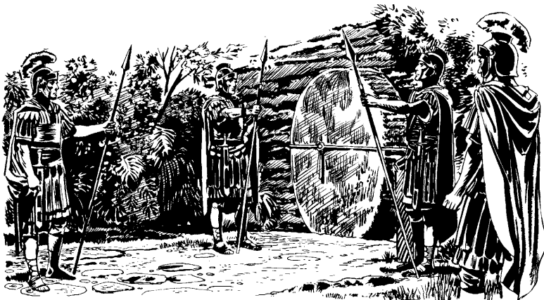
( Mateu 27.62-66 )

63 —Orerea'ar ore Jejuí 'ga 'meawer are. Amanũme'ẽwe 'ga 'meramũ ore ikue: “Anure nipo je manũ. A'ere nipo imuapya 'ara rupi je ferawi nũ”, e'i futatee 'ga ikue— 'jau 'gã imome'wau Piratu 'ga upe. 64 —A'eramũ jefaruu 'gã amũ iarũmũ ore. Kasi a'e pe 'ga remiayuwera 'gã nuri 'ga reumera rerawau imima kwe pe ne. A'eramũ 'gã 'jau ne: “Oferap futat 'ga u'ewer imũ etee futat ra'e”, 'jau futatee nipo