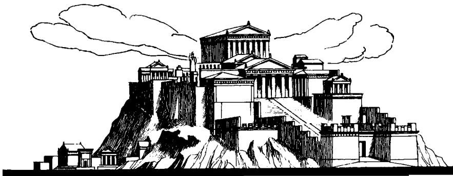
(Aõhebo Rotÿÿnyre 1.12)

12 Jesuisi erydÿÿna mahãdu ratximyhÿrenyre Oliveira ðwòruraty hãwãlò-ki. Tahe dðsedenyde Jerusalê hãwã-ð. Jerusalê rehe iribi doide sohoji urihixina rehemymyõlemy. 13 Tahe wii rotÿrenyre rorukure ixitðedÿÿmy hetoratyawo-ki. Kahekani-di rirana rarekre tai rÿimyhÿrenyre: Pedro, Joaõ, Txiau, Andre, Filipi, Tome, Bartolomeu, Mateu, ijõ Txiau (tii Afeu riðre rare), Simaõ Zelðte, Judasi (ijõ Txiau iwitxira, kia riðre rare). 14 Ijõ iny tule tai rononymhÿ, Jesuisise, hãwyw ijõ rononymhÿ, Jesuisi seriðre mahãdu tule rorukumyhÿrenyre. Ibutumy rexitðenymyhÿrenyre wiwese wiweselemy røhõtínymyhÿrenyre.