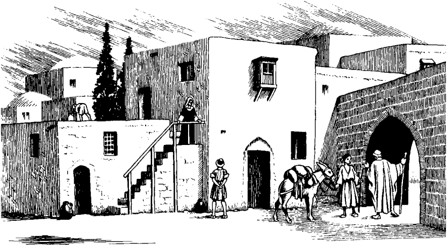
(Aõhebo Rotÿÿnyre 10.9)

Ixityre tamy rarybere: 15 —Aõbo Deuxu risuhore wese isuisumy rybeõmyke.