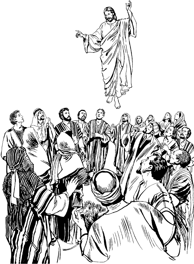
Jesucristo tsjun po'ó tjemey. (Hechos 1.9)

nun. Ca polel mvelé la p'a jilal napj mpes. Napj mpes solejé mpes ca mvelé. Nin ca la müjí Jerusalén nt'a, Judea nt'a 'ots'ipj, Samaria* nt'a 'ots'ipj, nosis casá jas tüpwes ca nin la müjí —nin tjevele Jesucristo.