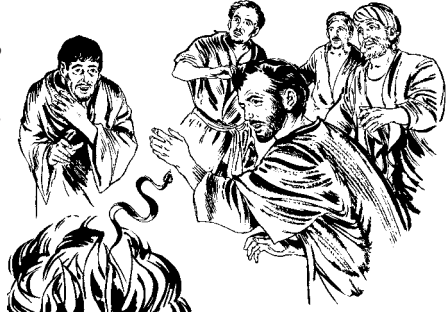
Latsj tjelyaja Pablo mos. (Hechos 28.3)

mo'ó. Mpes 'ücj cupj dios* lal jupj pe'e quinam, malala la tjiji mpes", nin tjowelepj. 5 Nin tuluctsja. Pablo latsj la syüpjünú, 'awa mo'o la ts'iya. Ma malala tepyala Pablo lal, 'üctsja jupj. 6 Ne'aj tapatja yólatsja Pablo ca nt'ünt'ünüs ca nacj. Leñ way mpa'is ca nacj, nin topon. 'Üctsja jupj. Püs tepyala na, newa ma t'yünt'ünú, 'ücj tjuwine jupj. Mpes p'a casá yólatsja quinam. Tjowelepj diospan* popa pjaní jupj.