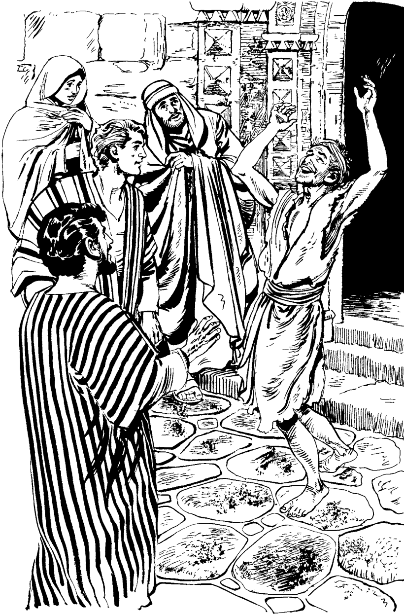
Ma wine tji'yü'sa, tólotsja, 'čj jostsja mpes. (Hechos 3.8)