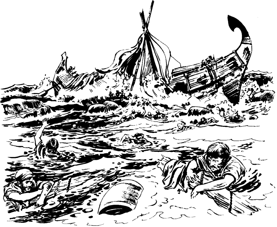
Barco la tju'u'na. (Hechos 27.43)

tjevele: “Nepénowa 'ücj 'üsüma la may jil. Mpes 'üsú nt'a ntoloqué nun, lowa 'amá nt'a. 44 La p'a ma polel la may, cjüil ca mal, nepénowa tabla casá ca mal, nepénowa barco* la tju'u'na casá ca mal”, nin tjevele jupj.