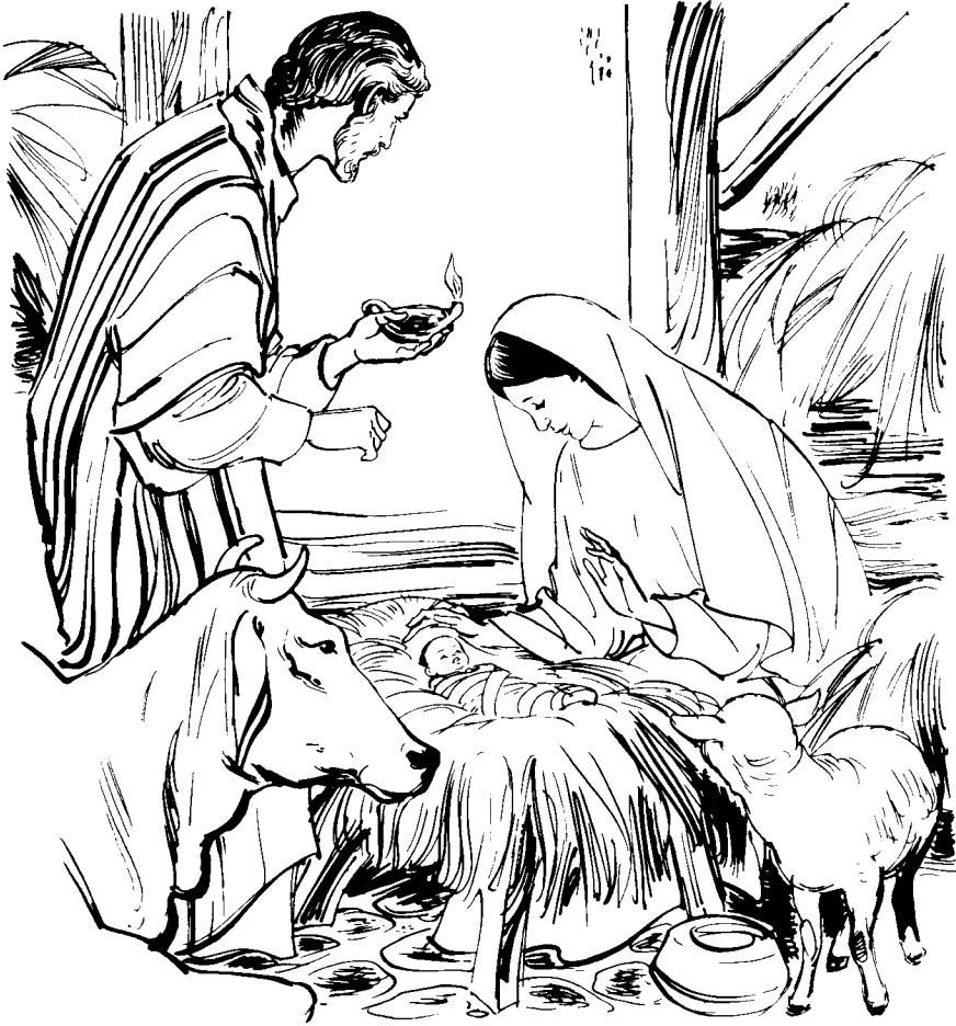
María jatjam mwalá tjemya'na jupj. (San Lucas 2.7)

14 “Qjuisas 'üsüs mvelecj Dios po'ó jupj pü'ü nt'a.