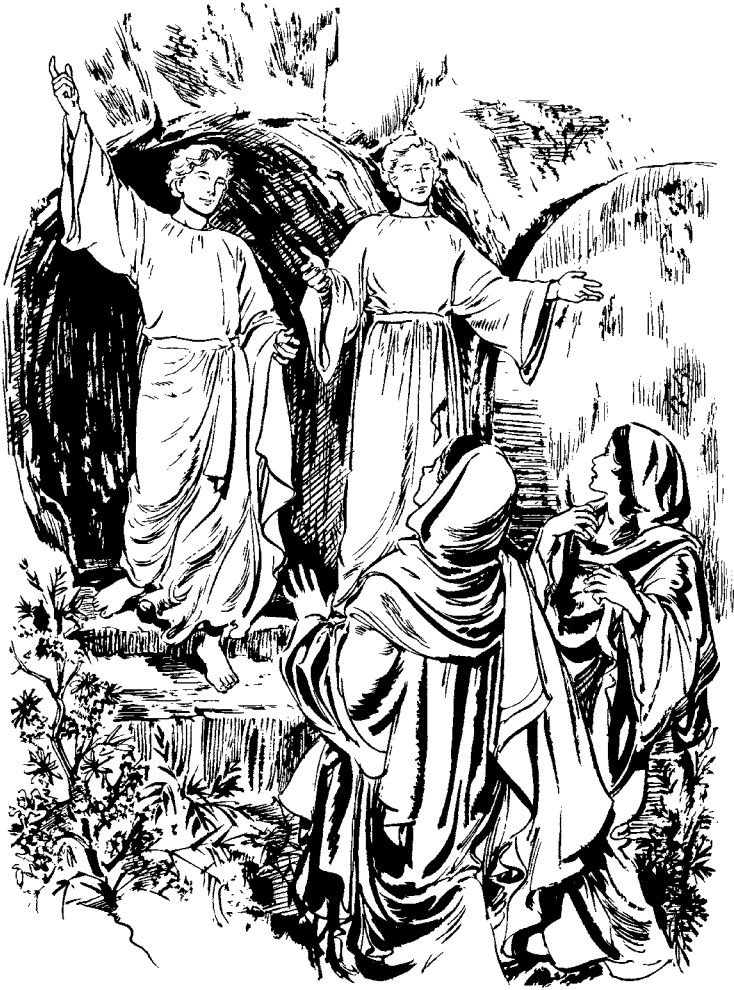
Angelpan lay jis tepyala, tjowelepj Jesús leñ quinam. (San Lucas 24.4)

once jilal tjowelepj pjü tepyalá jomwen jul nt'a. P'a discipulopan jis lal 'ots'ipj, pjü jis lal tjowelepj pjü tepyalá jomwen jul nt'a. 10 Nequem nenem María Magdalena lotsja pjaní wa, p'a wa Juana lotsja, María Jacobo jamaytsja pjaní wa. La p'a nequem jis lal tjiquil. 11 Discipulopan ma topon nequem tjowelepj. Nequem ma yola javelepj yólatsja yupj.