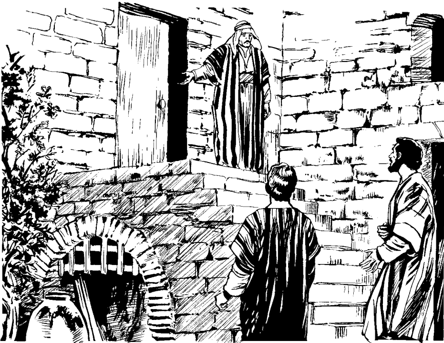
Ne'aj wo 'esepj nasa 'ücj la tjiji cuartas. (San Lucas 22.12)

13 Mpes tjil yupj. Pjü Jesús tjevele jin tepyala, ne 'ücj la tjajay yupj jis la las fiesta mpes.