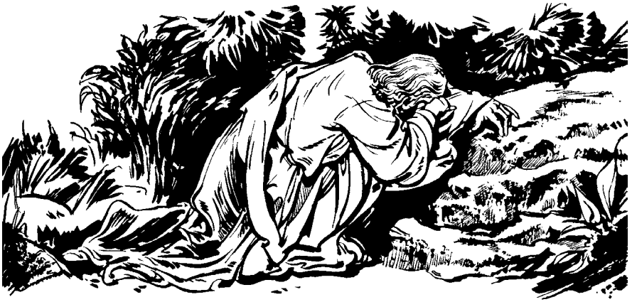
Jesús 'aplijila tepyala, tjevele jupj Popay lal. (San Mateo 26.39)

39 Jupj tsjicj way p'in mwalá tjemey jusapj. Palá nipi'tje 'amá 'alá. Tjevele Popay Dios lal: “Mpapay, ¿ncu 'ücj wa jipj lal napj ma ni pü'í? Jipj 'ücj polel lejay niná, najas ma ca nin ma palas. Newa najas ca jipj jyas jinwá nsem. Ma napj najas jinwá t'as”, nin tjevele Jesús jupj Popay lal.