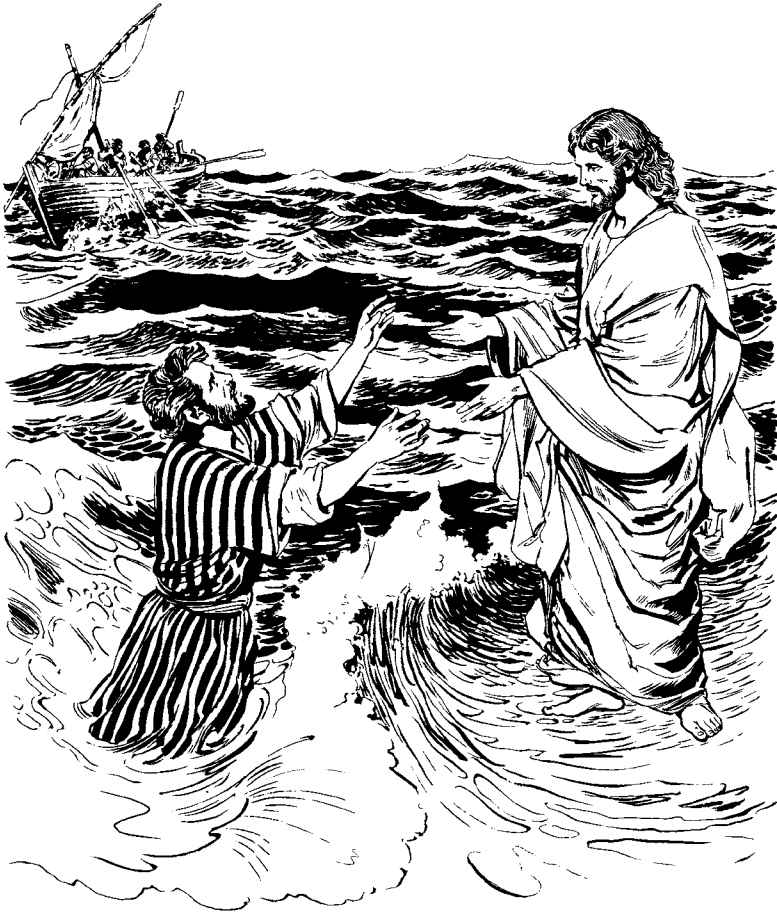
Jesús 'üsü casá wínetsja. (San Mateo 14.31)

—Nejepa, ncapj tjep'ya'sa —tjevele jupj.