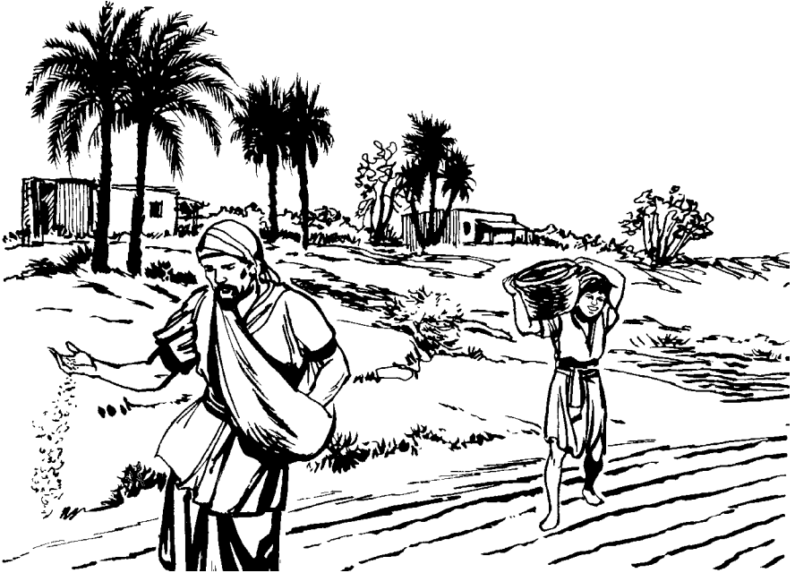
Tom setel sine wínetsja. (San Mateo 13.3-12)

newa ma yola se palá tsjan mpes januc niná. Yupj pjyacañ, newa ma salejepj tsjan mpes pjyacañ niná. Ma sin 'yüsa. 14 Tsjay püna Isaiás tepyaca yupj ca nin la mijicj. Dios p'iyá nin tjevele yupj mpes. Isaiás profétatsja* jupj. Jupj tepyaca jinwá jis tepyala quinam. Jupj tepyaca: