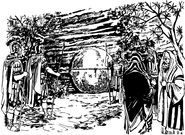
Militarpan jajamaptsja jomwen jul nt'a. (San Mateo 27.66)

66 Mpes tjil yupj. 'Ücj la tjajay jomwen jul nt'a. Jun t'yó'natsja jomwen jul, pe püné mpes. Hilo tsjicj way po'o tüpüntüpj pe wolap'a'á 'ots'ipj, ca jus nlayecj ncu wama jil gentas. Militarpan jis tjüjünsüpj tjil, militarpan jis la jamas ne'aj.