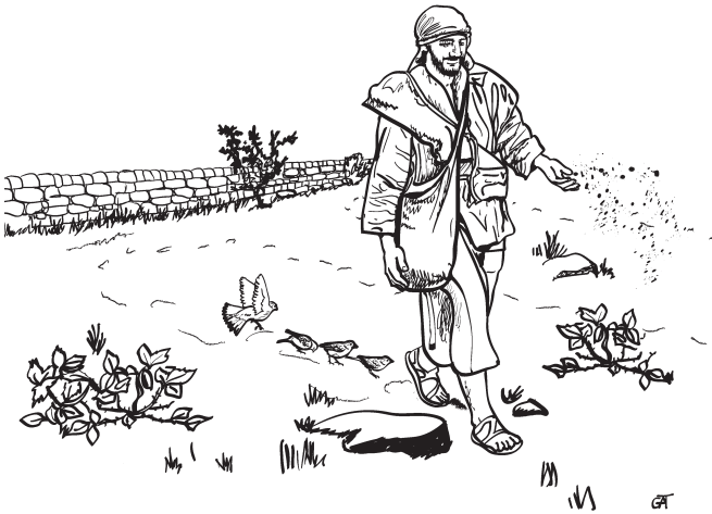
Mark 4: 3-8

pilakák hawá ittáak akaáhmaa pilakák hawá kúh itchikaasáak pilakisáak.” 9 Kalakoon Jesus hilíasheek. “Dáhkuxuwishdak díikukkukchiiaalah.” hek.