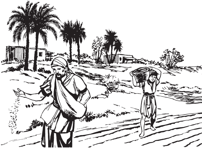
San Marcos 4:2-8