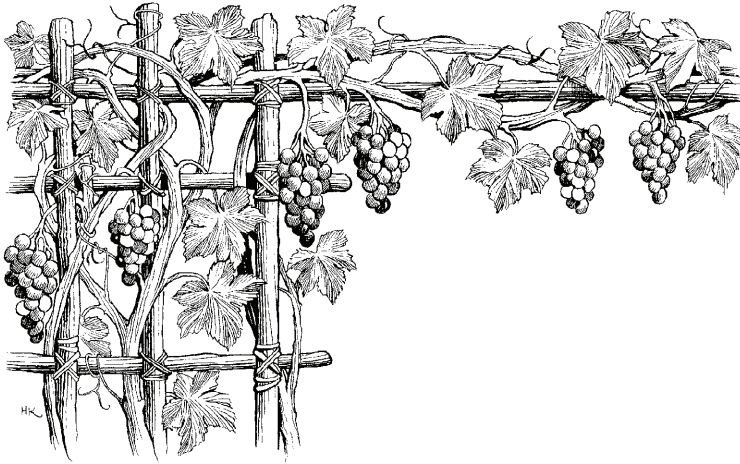
Pīsi uchea'me. (Ap 14.17)

uche okora'ka repavũ vũ'evũ cacojepi eta chiacha meañeja'ñe chie so'ona measi'kua'mũ, trescientos kilómetros repa so'o. Repa chiera'ka rũa rũiisi'kua'mũ.