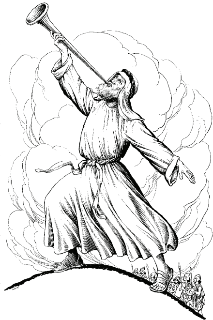
Trompetavū'te juhimū (1 Co 14.8)

13 Pāiū ūcuauakū tīpāichu'o cutumasikūji chekūnani re'oja'che cho'okasa chini Dioni ija'che sēejū'u: “Ja'kū Dios, tīpāichu'o cutukūta'ni masi asavesukū chekūnani masi asoche