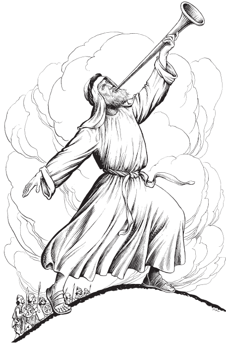
Dsa 3 'i 3 jiuu 32 cuoo 13 (1 Co. 14.8)

7 'E 3 quie 123 la 13 xen 3 ñí 2 'e 3 jiuu 32 te 123 'e 3 'a 23 jia 13 ri 3 ji 23 . ¿Jmii 31 cu 2 ru 13 jiuu 32 te 123 lúu 2 , cu 2 ru 13 tii 23 te 123 tu 3 ? 'Ne 12 'e 3 jin 3 ca 3 quiee 2 dxi 13 quiee 132 . Xi 3 nu 3 te 3 la 23 cu 2 ru 13 'ii 2 ca 3 dsaan 32 , 'a 23 jia 13 ri 23 dxoo 123 dsa 3 'ee 2 pieza jiuu 32 te 123 cu 2 ru 13 la 13 , ¿mi 3 naa 131 ? 8 'E 3 quie 123 la 13 , xen 3 cuoo 13 'e 3 jiuu 32 te 123 . ¿Jmii 31 cu 2 ru 13 'a 23 jia 13 ri 23 ii 2 jin 3 cuoo 13 'e 3 jmee 23 lii 23 'e 3 mi 3 tí 3 'e 3 ri 23 mi 23 tí 23 quie 12 dsa 3 'lóa 3 'e 3 si 3 jmóo 2 qui 3 ? 'A 23 jia 13 ri 23 mi 23 tí 23 te 123 cu 2 ru 13 la 13 , ¿mi 3 naa 131 ? 9 La 23 xen 3 lúu 2 , la 23 xen 3 tu 3 , la 23 xen 3 cuoo 13 xen 3 'oo 31 ra 13 . Xi 3 nu 3 lá 2 ra 13 júu 2 'e 3 'a 23 jia 13 ri 23 dxoo 123 dsa 3 , 'a 23 jia 13 ri 23 núu 23 te 123 'e 3 jmií 131 juo 13 ra 13 xi 3 nu 3 la 13 , ¿mi 3 naa 131 ?