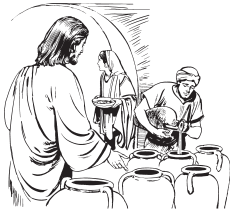
'E 3 la 23 ca 23 xi 123 te 123 jmii 3 mi 2 dsuu 2 (Jn. 2:7)

11 La 13 cu 3 lø 31 ca 23 jmée 3 Jesús juui 3 Caná estado Galilea. Mi 2 jø 3 ca 23 la 23 lúa 23 'e 3 jmee 23 u 23 juø 123 'e 3 jmee 23 lii 23 'e 3 bi 23 gáan 3 'ñée 2 . 'E 3 jø 3 ca 23 táan 3 quia 12 Jesús te 123 dsa 3 quien 32 .