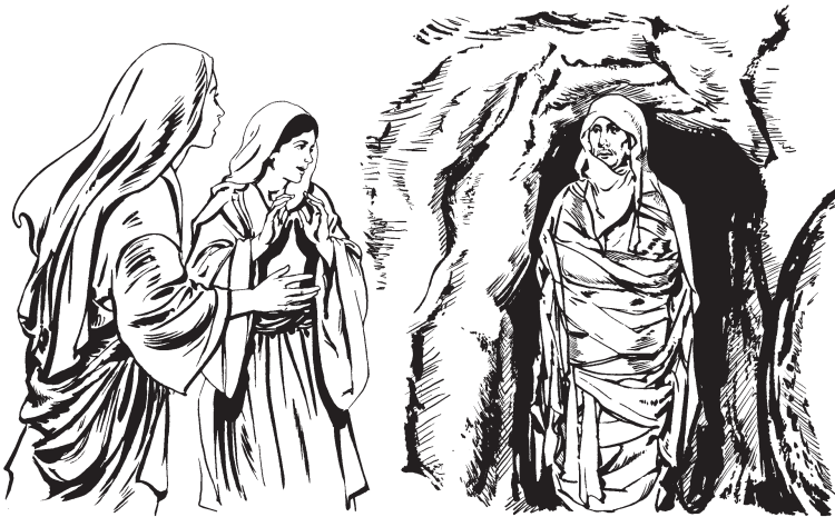
'E 3 la 23 ca 23 bón 3 'lí 3 Lázaró (Jn. 11:44)

—Jee 123 na 13 'mii 13 'e 3 ri 3 laan 3 Lázaró. Qui 2 cu 2 ñí 3 .