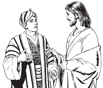
Xii 13 'i 3 ri 3 løn 31 dsa 3 xoo 32 (Mt. 19:22)

22 Ma 2 ca 1 núu 3 xii 13 'e 3 la 23 ca 23 jua 13 Jesús, bi 23 ηí 3 dsí 2 'e 3 ηø 1 n 2 quie 12 . Qui 2 bi 23 ñúun 3 la 23 ji 3 'e 3 xa 3 quie 12 .