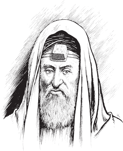
Dsa 3 'i 3 too 23 mi 31 tuu 13 qui 2 quia 12 cuáa 2 (Mt. 23:5)

8 'E 3 quie 123 'a 23 jia 13 dxi 3 jii 31 'e 3 ri 23 si 123 te 123 'nee 123 dsa 3 'e 23 . Qui 2 jøn 3 dsa 3 'e 23 quien 32 na 13 xen 3 . 'E 3 quie 123 ri 3 løn 31 na 13 la 23 ca 3 jáan 2 na 13 la 23 jin 3 na 13 . 9 'E 3 quie 123 la 13 'a 23 jia 13 dxi 3 jii 31 ri 2 juo 12 ra 13 ñu 12 ri 2 jui 131 ra 13 dsa 3 mi 31 güi 3 . Qui 2 jøn 3 ñu 12 ra 13 xen 3 'i 3 jen 31 yuu 31 güi 3 . 10 'E 3 quie 123 la 13 'a 23 jia 13 dxi 3 jii 31 'e 3 ri 23 si 123 te 123 'nee 123 juii 23 . Qui 2 jøn 3 jui 3 ra 13 xen 3 . Cristo hua 2 'i 3 . 11 'Nee 123 'i 3 ri 3 løn 31 mozos 'i 3 mi 3 quin 3 uu 12 , 'i 3 'i 3 hua 2 'i 3 gáan 3 ci 2 jee 232 quien 32 na 13 . 12 'E 3 ci 2 li 23 uøn 23 dsa 3 'i 3 mi 3 gáan 3 'ñée 2 . 'E 3 quie 123 'e 3 ci 2 li 23 gáan 3 dsa 3 'i 3 mi 3 uøn 23 'ñée 2 .