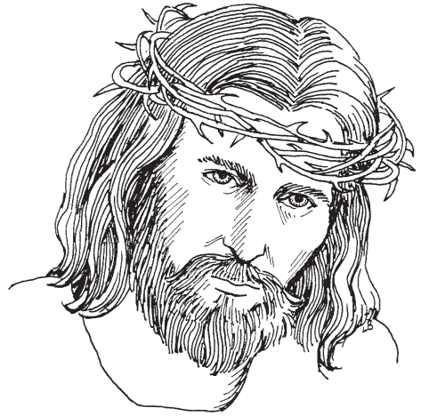
Lii 2 sii 3 'e 3 tóo 2 (Mt. 27:29)

30 E 3 quie 123 jo 3 ca 23 ø n2te 123 Jesús. Ca 23 coo 23te 123 co 13 sii 2 'e 3 xee 13 'ñée 2 . Ca 23 jmi 2te 123 mi 2dxi 2 . 31 Ma 2 ca 1líi 1 ca 23 jáa 2 ca 23 ñín 2te 123 , ca 23 dxin 3te 123 'mii 3 'e 3 yúu 3 . Ca 23 qui n2te 123 co 13 cuoo 3 'ñée 2 . Ca 23 jøn 23te 123 je 2 ri 23teen 3te 123 cruz.