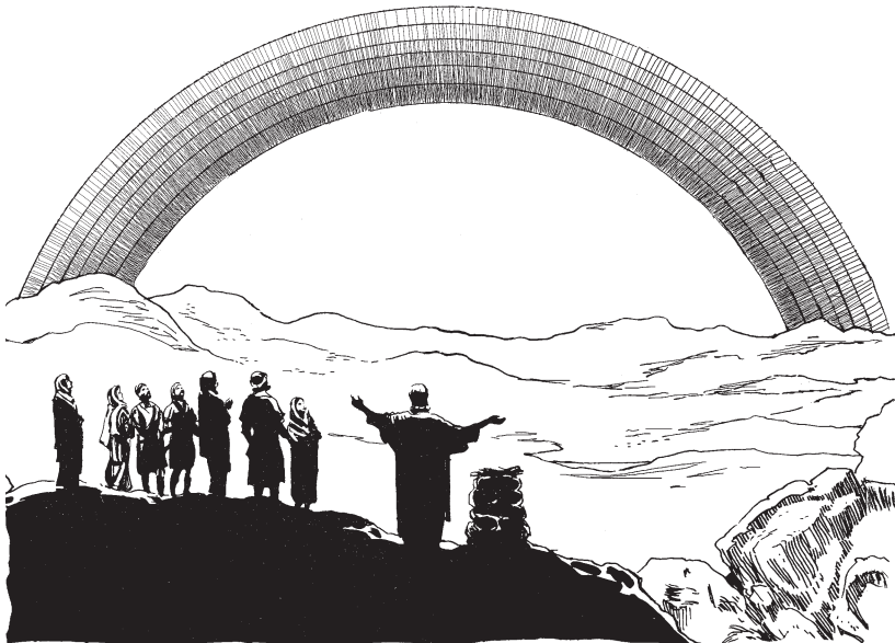
Diosan nón bai naí kuinu mëramia.

12 Ënëx ka a 'unántiokin achúshi ñu mitsubëtan 'akin manutima okin, kamabi ñuina kamabëtan-ribi 'akë 'ikën: 13 'ën kana nón bai naí kuin kamanu anuaxa mëratiokin nan, ax ka achúshi ñu 'ën mibëtan 'akësa 'iti 'ikën. 14 Usa