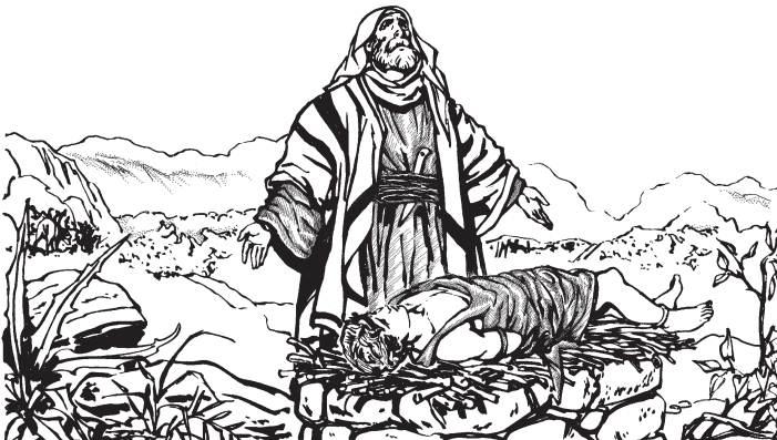
Diosan Abraham asérabi kara ami sinania isnuxun tan.

9 Anu kuanuan Nukën 'Ibu Diosan kakë matá me anu bëbaxun, ka Abrahamnën anuxun ñuina xaroti maxax bukunruakëxa; usakin bukunrutankëxun ka karu-ribishi tíkati mabukuntankëxun aín bëchikë Isaac aribi nëakëxa, nëaxun ka anu ñuina xarotinu nankë karu kamanan; 10 rakankëxa rakamainun ka aín manë xëtókë bikian aín bëchikëmi okin sananiabi ka 11 nukën 'Ibu ángelnën kuënkín nañuxun kakëxa: