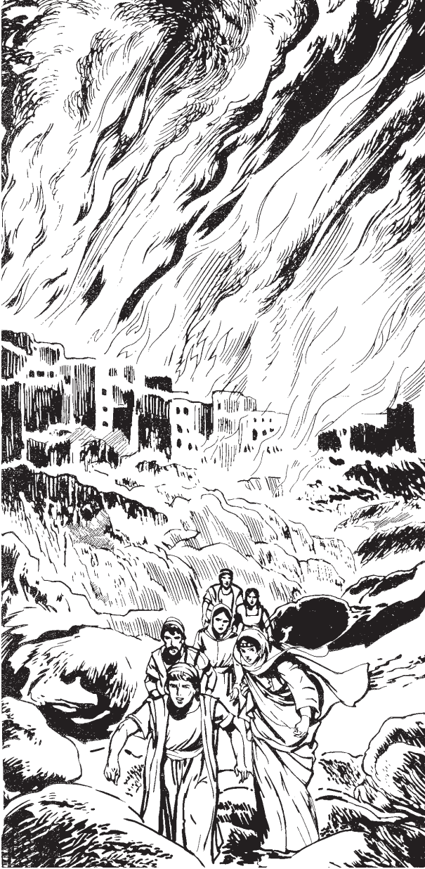
Tsi 'imainun asufre naínua 'ibumikin Diosan Gomorra 'imainun Sodoma kéñua.