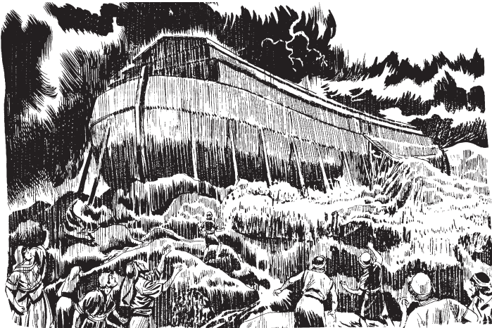
Bakan tita ikuatsinkin kamabi ñu këñuanan uni këñua.

17 Usa 'ain ka baka chaiira 'ëké ax cuarenta nētë 'uñe 'aisamaira 'ibúakëxa. 'Ibúkëbë bakan tita 'ikuatsinkëbë mebi mapurukëbë ka nunti chaiira ax menuax nunkati bëspúruakëxa. 18 Bakan tita 'ëkin abira abi mapurukëbë nunti chaiira axribi, bëspúru nunkákëxa. 19 Chaiira bakan tita 'ëkin ka aín bashi chairukë abi mapurukin me 'aíma 'itánun mapuakëxa; 20 usakin aín bashi-kama maputankëx ka anuishi sënënimapa achúshi 'imainun rabé manámiki bakan tita 'ëi sënëankësa. 21 Usai 'ikin ka kamabi uni ënë menu tsókë këñuakëxa, ñuina pëchiñu 'imainun 'arakakë ñuina 'arakatima ñuina axa men niríkë ñuina akamax 'ikësaribiti