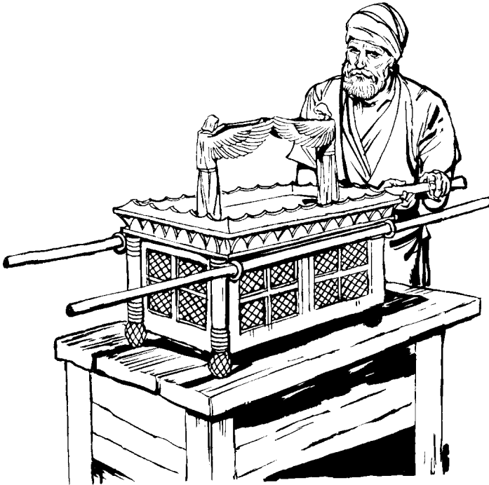
Dios chani jaya ca caja-cajaria

niahacaxëti xo toa jabi bo iquia, xabahamati quinia paxa ca joni iqui na.