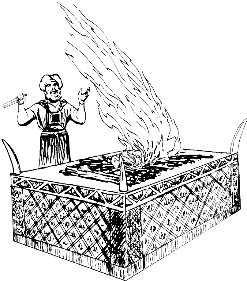
Dios qui ofrenda Moisés, Aarón, tihi cabá ocaina

arati ibo bo quirima xo. Jabi jatiroha ca barí tsi jahuëcara ca ofrenda Dios qui acani quiha noba arati ibo bo. Tocacani quiha jato jocha yoi, jato nohiria ba jocha, tihi cabo quëshpi na. Jama xo Cristo ra. Huësti ca ofrenda roha Dios qui ja aniquë ra, jamë yoi ja aniquë no, nati. 28 Jasca, toa jariapari ca quiniá tsi chamayama ca jochahai ca arati ibo bo janahacaniquë nohiria bo mëbiti. Jama, oquë-oquëria ca Arati Ibo Diós janani quiha, “Noho jané tsi parayamaquia” i ja quë no. I-ipahai ca oquëria ca Arati Ibo-iboria ca tsi xo naa ra.