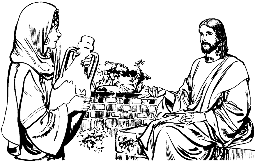
Samariá ca yoxa Jesu qui chitiminina