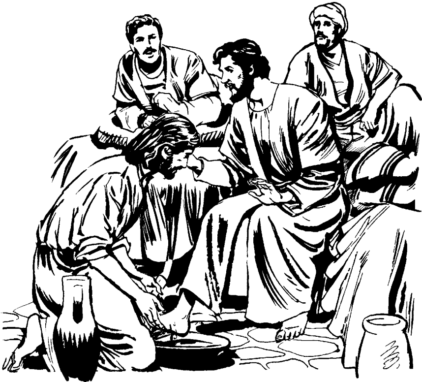
Pedro tahë Jesú ashimanina

—Noho tahë ashimayamapistiariaxëqui mia ra —i Jesu qui Pedro niquë. Jatsi Jesú quëbiniquë: