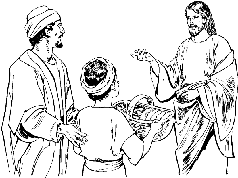
Jesu qui jahuë tapeque baqué anina San Juan 6.9

tsi quiha sani nohiria bo qui ja mëaniquë. Jatsi nohiria bá piniqüë. Ja sëyacaniquë. 12 Sëyajacaqüë tsi quiha,