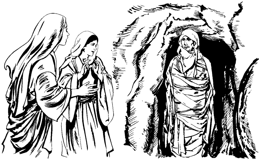
“Huajahuë, Lazaró” i Jesu nina

49 Jatsi chanitsi jato huésti ca niquë, naa Caifas icanai cato. Jabi toa xëni no tsi quiha jato arati ibo-iboria ja ini quiha. Jatsi,