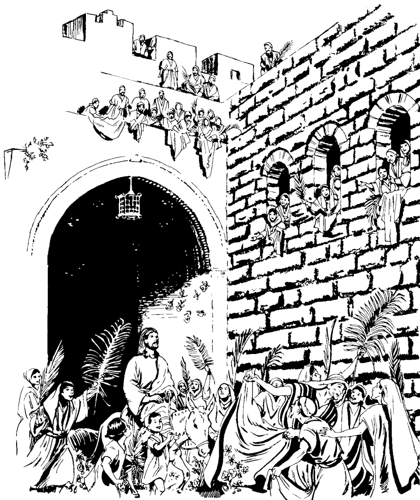
Jerusalén qui Jesu jicohaina