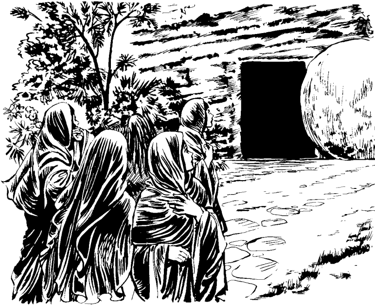
Jesu yora ja yopacanaina San Marcos 16.4

9 Semana jariapari ca barí tsi quiha Jesu bëсотëquënicuë. Bëсотëquëhax tsi María Magdalena, naa siete ca yoshi jayapaonish ca qui ja jisiquiniquë. Jahá ca yoshi bo ja niani quiha. 10 Jatsi quiha María