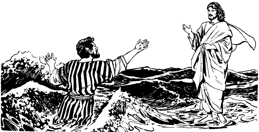
Jesu qui Pedro cacasnina W

34 Jatsi quiha ia ja shitacaniquë, naa Jesu, jahuë rabëti bo. Shitaxo tsi quiha Genesaret mai qui ja rërëcaniquë. 35 Toá ca