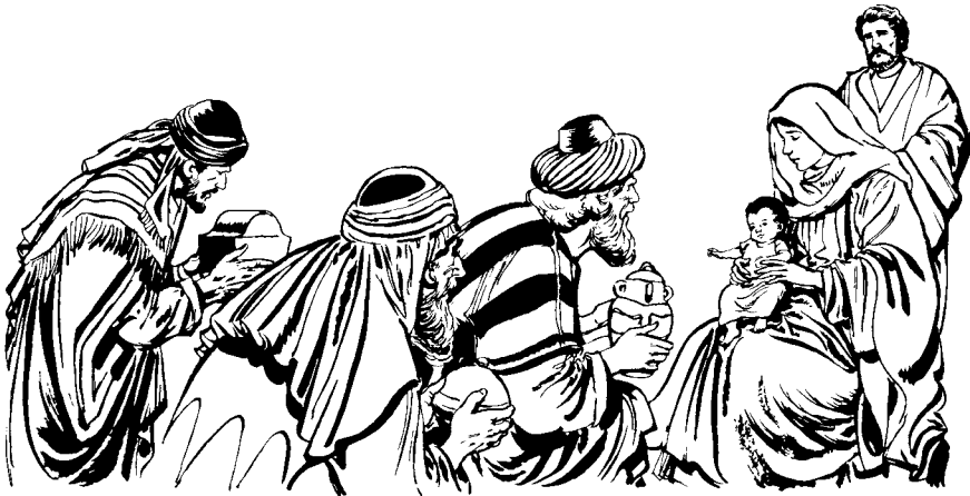
Joni tiisi bo baquë Jesu qui aranina

9 Jatsi quiha Belén qui bocatsi quiha tiisi jaya ca joni bo niquë, Herodes nichahax na. Ja bocaquë tsi quiha jisiquitëquëniquë huishtima, naa jato maí tsi jisiquinish ca huishti jascaria cato. Jisiquixo tsi quiha Belén qui jato ja mëpiniquë. Jatsi Baquë Jesu ini ca iti qui cahëhax huishti niiniquë. 10 Jatsi ja rani-ranicaniquë, huishti jisi na. 11 Ranihak José xobo qui ja jicocaniquë. Jicoxo baquë ico ca María ja jiscaniquë. Jatsi ja mënicaniquë. Mënihax ja qui ja aracanicuë. Jaquirëquë quiha jato sota bo ja pëcaticaniquë, ja