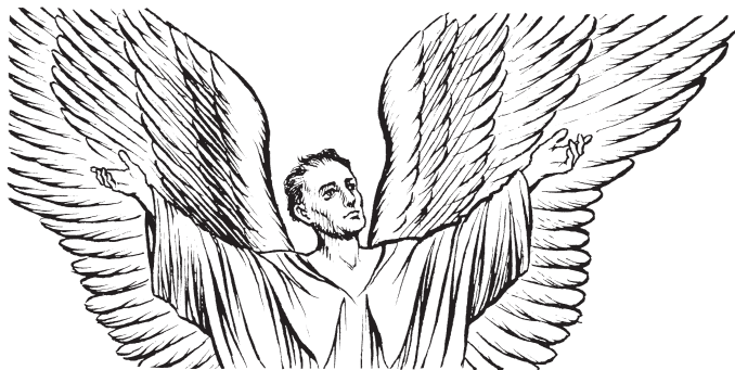
A eb' ángel (Sal 34.7)