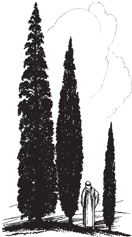
A te te' vach' yaj yavchaji (Sal 148.9)