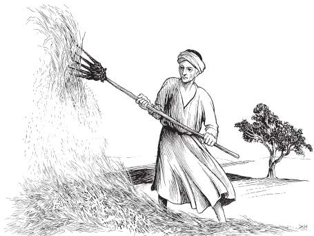
A smatz'il ixim trigo (Sal 1.4)