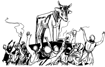
(1 Coríntios 10.6-10)

12 Awylygue mâkâ, “Koendonro urâ. Âdaunloenlâ akaemo saguhoobyry modo aitobyry ara awitaymba ise