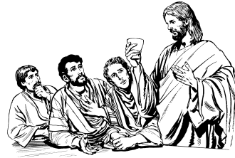
(1 Coríntios 11.23-26)

27 Mâkâ pão tiendawynday, vinhu tienyday warâ adâjito araba kulâ aini Deus aiedyseba ato kulâ anhekyly. Jesus kruz wâgâ âdyopyy, iunu apâdyby warâ âdyempa nhedyly kulâ. Inakanhe tâjidilylâ awârâ! 28-29 Mâkâ Kywymâry Jesus kruz wâgâ iguely kâmakezelâ awyly wâgâ nâpaunzebyra kulâ pão nhedawynly, vinhu nhenyly waunlo, Deus enagazenehonze. Awylygue, Jesus iguehobyry enanâguehoam mydâlymo iraynâ âwâlâ adapâigüewâdaungâ: “Tâlâ wânâ inakanhe awito Deus nhyakehoem kâenkadânry?” kewâtaungâ. Tâlâ-ro watay, xirâ umelâ ekadaungâ, nhyakehoem. Arâma ise tâwâlâ pão mâendawynlymo, vinhu mâenylymo warâ. 30 Tâlâ âmaemo ewy Deusram âkadudânry modo. Awylygue ewâmadylymo, ton-honremba idylymo, iguelymo warâ.