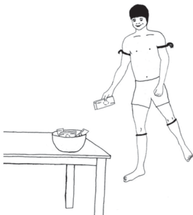
Sikūn Korīt 9.7

10E pa ixprĩ hã mē amã ja jarē ka mē inhma. Nà na hte ã Tirtūm mē pamã mē paxàpkur xà nhōr o pa anē. Kot kaj apur kãm ahkre nhūm tanhmã amã mēmo hyta nhĩpêx to nhūm amã hapôx mex nē amã õ rũnh nē ka anhō rax nē. Nē hkwȳ ho axàpkur o apa nē axte hkwȳ hkre. Tã kêr ka mē ã Tirtūm kot mē ato mex anhÿr ã amnhĩ pumu hãmri nē uræk nē axàmnhĩx ri mē kêp amrakati xwÿnhjê mã axàmnhōr pē mē ho mex o ri apa. Nhūm Tirtūm mē hã mē apumu nē mē amã mēmoj nhōr rãhã nē. Ka mē amnhĩ pyrã nē mē kêp amrakati xwÿnhjê mã hkwȳ nhōr o apa. 11Koja Tirtūm mē ato mex rax nē ka mē anhō mēmoj rax nē. Ja o amnhĩ xwar mē kêp amrakati xwÿnhjê kaxyw kàxpore hkwȳ jaxwÿ. Kêr pa mē amã hkwȳ jamÿ nē ma Tirtūm kôt mē pahkwÿjê mã o mō nē mē kãm kugō kê mē omu nē hkĩnh nē. Nē mē atã Tirtūm mã mex o mex ã harē. 12Hãmri nē mē akukwak ri mex nē ri pa. Nē axpên mã Tirtūm mex