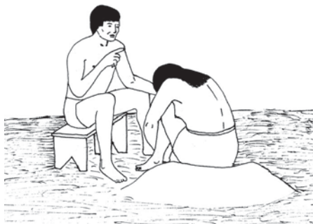
Sikũn Korõt 1.3-4

mex to ho pa. Kot puj mẽ mẽmoj tă tanhmã amnhĩ to nẽ pahkaprĩ nẽ ri papa nhũm ja hã mẽ pahpumu hãmri nẽ hamaxpẽr pix o akupỹm mẽ pahto mẽ paxihtỳx. Mẽmo kaxyw na hte ã mẽ pahto mex anẽ? Nã mẽ pahte amnhĩ tă omunh nẽ amnhĩ pyrãk mẽ hkaprĩ nẽ ri mẽ pa xwỳnhjẽ jamaxpẽr o hihtỳx o mẽ hkõt papa kaxyw. Ja kaxyw na hte mẽ pajamaxpẽr o hihtỳx. Jakamã kwa pu mẽ kãm mex o mex ã mãn harẽnh rãhã ho papa.